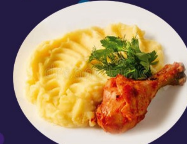
ПЮРЕ КАРТОФЕЛЬНОЕ С КУРИЦЕЙ