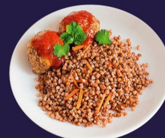
МЯСО С ГРЕЧКОЙ