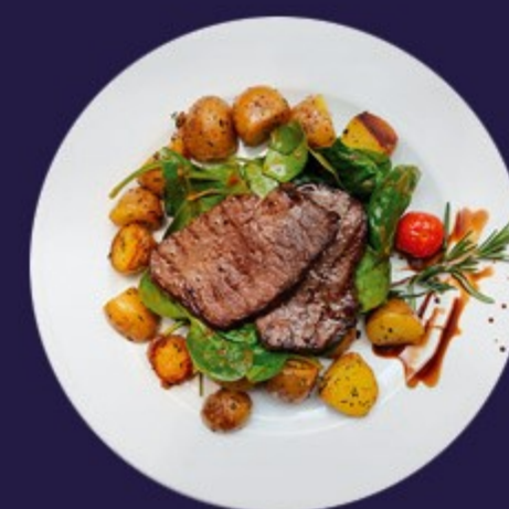
СВИНИНА С ОВОЩАМИ